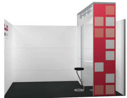
Variante einseitig offen